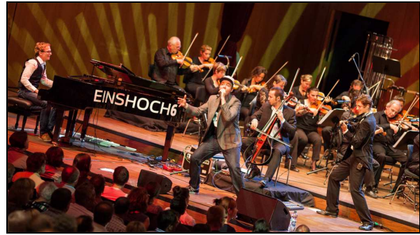
Die Württembergische Philharmonie Reutlingen gemeinsam mit EINSHOCH6

Die Württembergische Philharmonie Reutlingen gibt es seit 1945. Sie ist das Landesorchester von Baden-Württemberg, tritt aber auch in anderen Bundesländern und im Ausland auf. Das musikalische Programm ist abwechslungsreich: Neben klassischen Konzerten wird auch viel Neues ausprobiert. So gibt die Philharmonie z. B. auch Konzerte mit Lesungen oder hat Vorstellungen mit Musikern anderer Musikrichtungen.