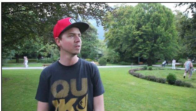
Ein Park für Michael Ende

Mitten in Michael Endes Geburtsort Garmisch-Partenkirchen befindet sich der Michael-Ende-Kurpark. Dort gibt es viele Ecken, wo sich Besucher entspannen können – wie z. B. einen Barfußweg, ein Kneipp-Becken und Ruhezone. Skulpturen erinnern an Michael Endes Werke. Im Kurhaus können sich die Besucher in einer Dauerausstellung über das Leben Michael Endes, seine Werke und seine Gemälde informieren. Er selbst hat im Park eine Linde gepflanzt, die seine Verbundenheit mit Garmisch-Partenkirchen symbolisieren soll.