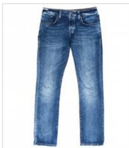
a) die Jeans