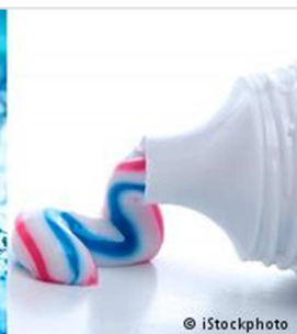
d) die Zahnpasta