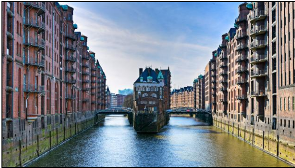
Die Speicherstadt – ein Wahrzeichen Hamburgs

Die Speicherstadt ist ein Teil Hamburgs und gleichzeitig ein Wahrzeichen dieser Großstadt. Ab 1883 wurde sie erbaut. Sie besteht aus dem weltgrößten zusammenhängenden Block von Lagerhäusern. Die Lagerhallen sind auf Eichenpfählen errichtet. In der Speicherstadt gibt es mehrere Kanäle, die mit Wasser gefüllt sind und je nach Gezeiten von Schiffen befahren werden können. Nachts werden die Gebäude von bis zu 800 Scheinwerfern angestrahlt, sodass die Speicherstadt gerade bei Dunkelheit ein beliebtes Ziel von Touristen ist. Seit 1991 steht der Stadtteil unter Denkmalschutz.