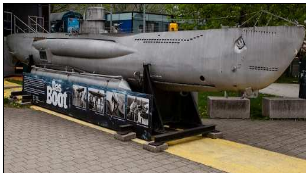
Das nachgebaute U-Boot für den Film in der Bavaria Filmstadt

„Das Boot“ ist ein deutscher Spielfilm des Regisseurs Wolfgang Petersen aus dem Jahre 1981. Es ist die Verfilmung eines gleichnamigen Romans aus dem Jahr 1973. Der Film handelt von der Besatzung eines U-Bootes im Zweiten Weltkrieg, die den Auftrag hat, englische Transportschiffe zu versenken. Mit 32 Millionen DM Produktionskosten war der Film 1981 nach „Metropolis“ (1927) der zweitgrößte deutsche Film aller Zeiten. Mit dem Budget wurden unter anderem zwei aufwändige Modelle des U-Bootes finanziert. Der große Aufwand hat sich für die Macher gelohnt: „Das Boot“ ist einer der erfolgreichsten deutschen Filme aller Zeiten. Allein in den USA spielte er elf Millionen US-Dollar ein. Er wurde für sechs Oscars nominiert. Wolfgang Petersen verhalf dieser Erfolg nach Hollywood, wo er Filme wie „Air Force One“ (1997) und „Troja“ (2004) machte.