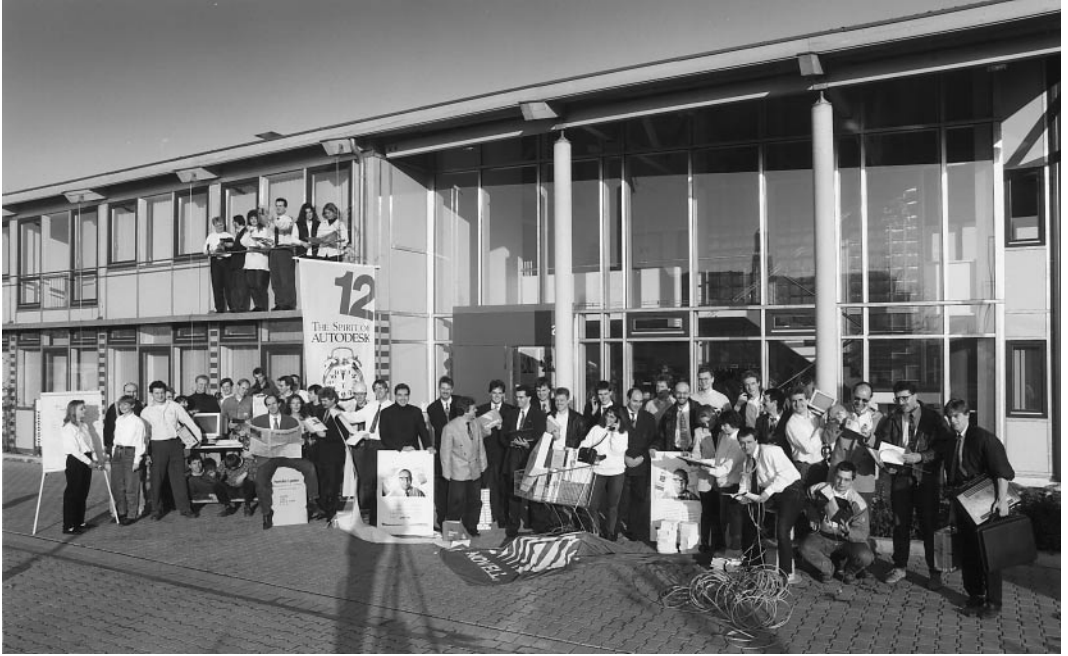
Die Mitarbeiter der Firma hancke & peter, Aachen