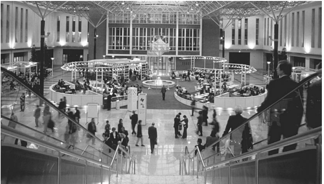
Eingangshalle, Messe Köln

Einer der führenden Messeplätze in Europa und Übersee heißt Köln. Köln ist heute für über 20 Branchen und Wirtschaftszweige weltweit der Messeplatz Nr. 1. Mit 36 internationalen Messen und Ausstellungen im Programm ist der Messeplatz Köln weltweiter Umschlagplatz für Waren, Dienstleistungen und Informationen. 30.000 ausstellende Unternehmen, davon 50 - 60% aus dem Ausland, sind dabei regelmäßig beteiligt. Ihr Angebot trifft mit der Nachfrage von 2 Millionen Einkäufern und Fachbesuchern aus 160 Ländern zusammen. Köln hat mit über 30% unter allen bundesdeutschen Messeplätzen den höchsten Anteil an internationalen Besuchern. Doch die hohen Besucherzahlen allein garantieren dem Aussteller und Fachbesucher noch keine erfolgreiche Messe. Wichtig ist, daß eine große Anzahl kompetenter Fachleute zusammenkommt. Die KölnMesse hat sich mit großem Erfolg auf weltweit bedeutende Fachmessen spezialisiert. Über 90% der exportfähigen Weltproduktion einer Branche sind auf den jeweiligen Leitmessen vertreten. Nahezu die Hälfte der Messethemen befaßt sich mit Hightech- und Investitionsgüterbereichen. Auf 260.000 Quadratmetern bieten sich dem Messebesucher Märkte, die einen umfassenden Überblick über das Angebot einer Branche ermöglichen. So haben die „photokina“ oder die „Anuga“, die „Orgatechnik“ oder die „Süßwarenmesse“ weltweite Pilotfunktion in ihrer Branche.