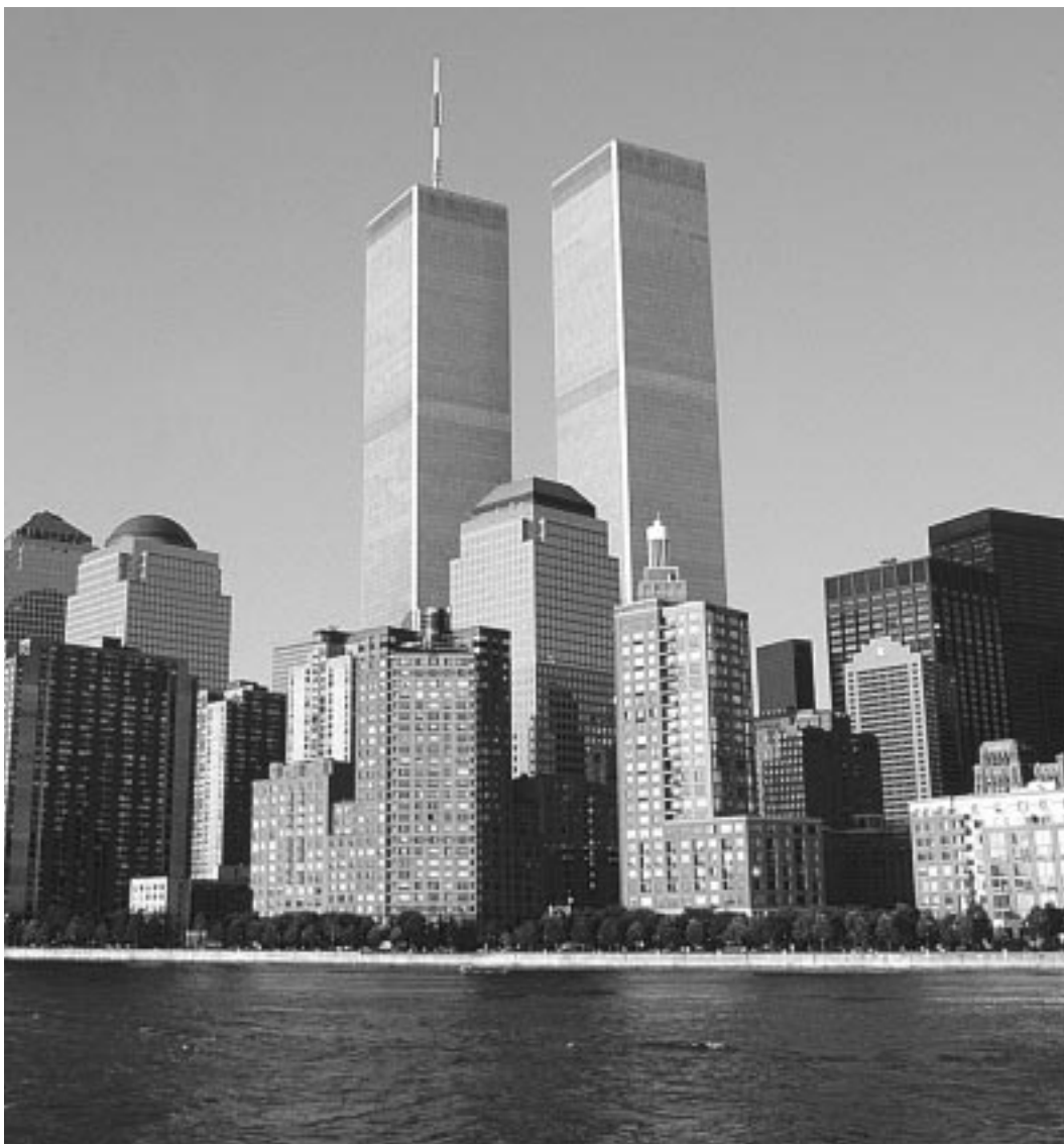
New York City, World Trade Center

Die Direktinvestition ist die weitreichendste Form unternehmerischer Tätigkeit im Ausland. Auch deutsche Unternehmen haben in den letzten Jahren ihre Auslandsaktivitäten massiv verstärkt. Die Ziele einer Auslandsinvestition können ganz unterschiedlich sein und müssen gründlich analysiert und gegen mögliche Risiken abgewogen werden.