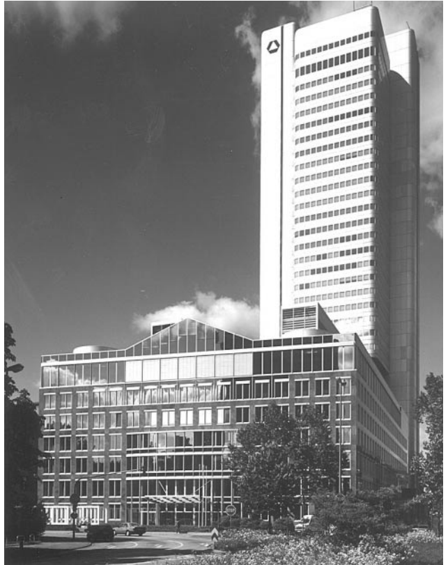
Verwaltungs- und Bankgebäude der Dresdner Bank AG in Frankfurt/Main.