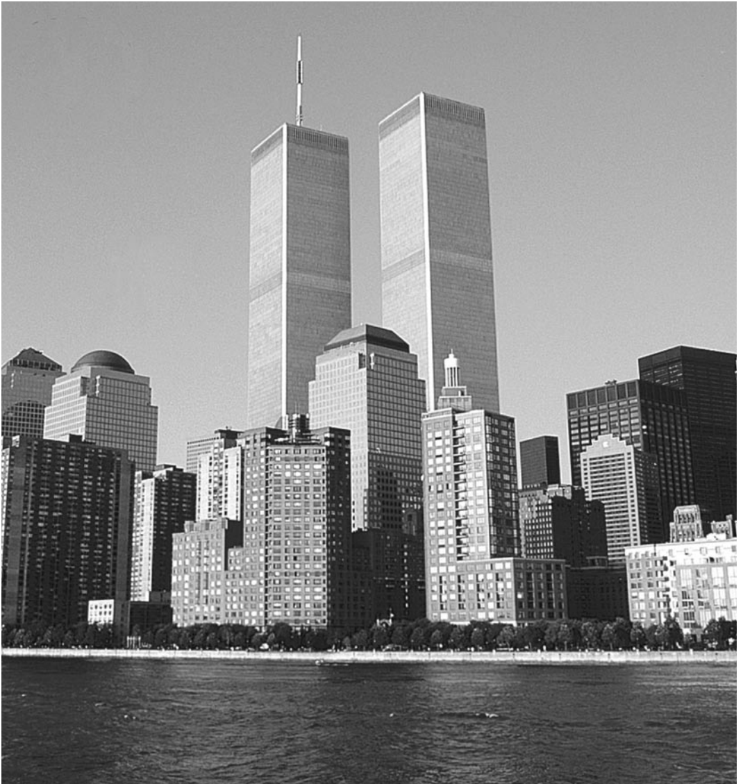
New York City, World Trade Center

Die Direktinvestition ist die weitreichendste Form unternehmerischer Tätigkeit im Ausland. Auch deutsche Unternehmen haben in den letzten Jahren ihre Auslandsaktivitäten massiv verstärkt. Die Ziele einer Auslandsinvestition können ganz unterschiedlich sein und müssen gründlich analysiert und gegen mögliche Risiken abgewogen werden.